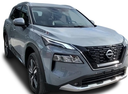
Tagesangebot Nr. AK-106034 vom 23.04.2024