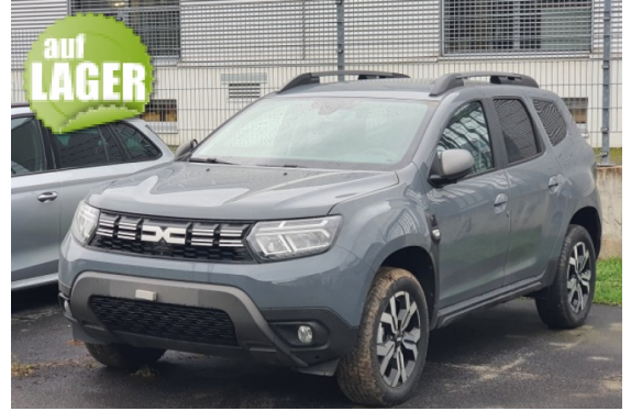
Tagesangebot Nr. K-106288 vom 22.02.2024