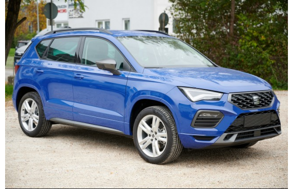
Tagesangebot Nr. AK-106401 vom 14.02.2024