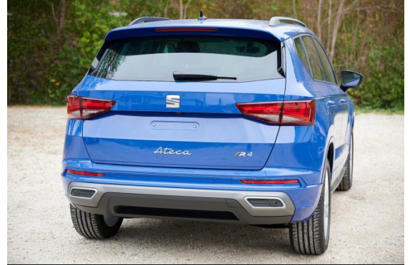
Tagesangebot Nr. AK-106457 vom 14.02.2024