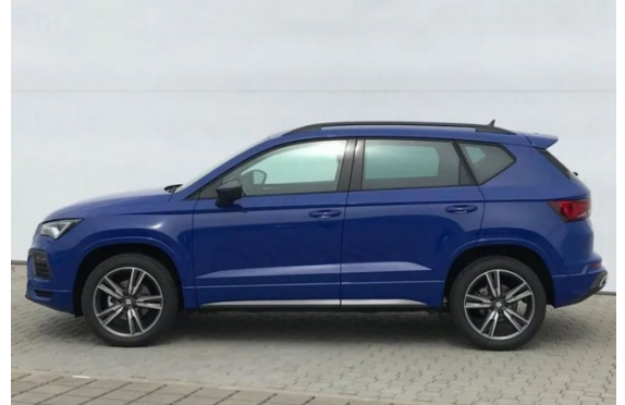
Tagesangebot Nr. AK-106441 vom 14.02.2024