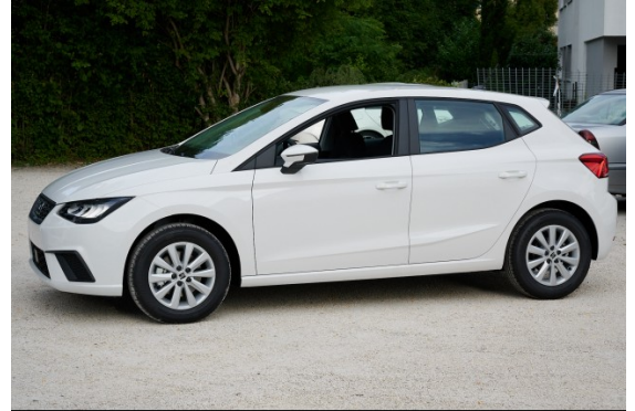
Tagesangebot Nr. AK-106499 vom 15.02.2024