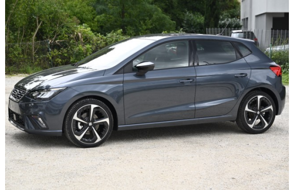
Tagesangebot Nr. AK-106493 vom 15.02.2024