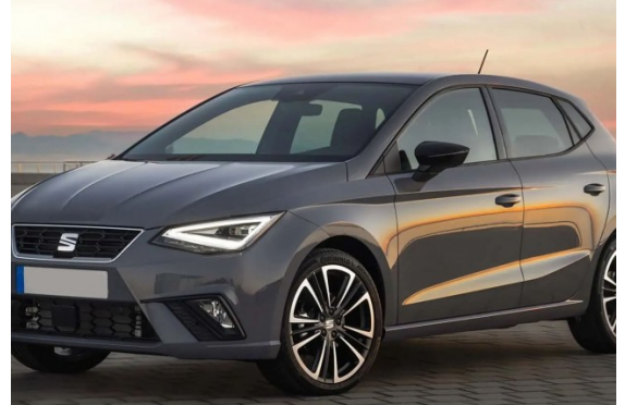
Tagesangebot Nr. AK-106507 vom 15.02.2024