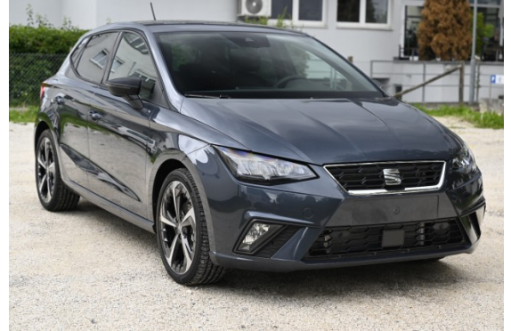
Tagesangebot Nr. AK-106505 vom 15.02.2024