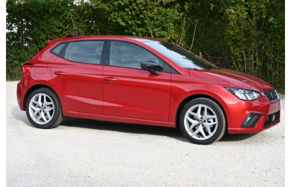
Tagesangebot Nr. AK-106514 vom 15.02.2024