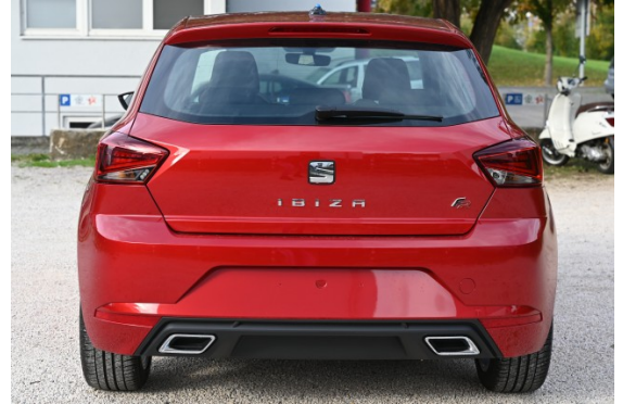
Tagesangebot Nr. AK-106513 vom 15.02.2024