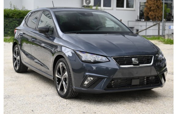
Tagesangebot Nr. AK-106530 vom 15.02.2024