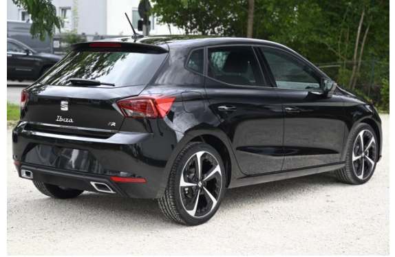
Tagesangebot Nr. AK-106528 vom 15.02.2024