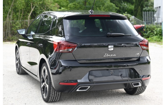
Tagesangebot Nr. AK-106527 vom 15.02.2024