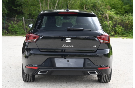
Tagesangebot Nr. AK-106521 vom 15.02.2024