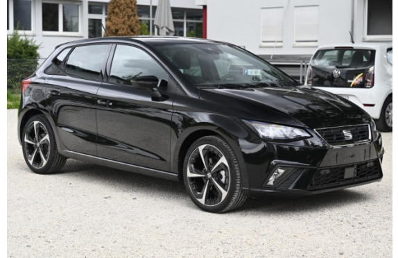
Tagesangebot Nr. AK-106520 vom 15.02.2024