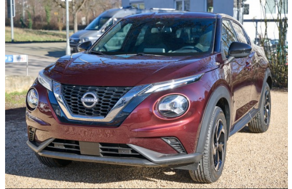
Tagesangebot Nr. AK-106545 vom 17.02.2024