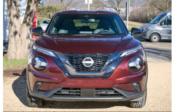
Tagesangebot Nr. AK-106557 vom 17.02.2024