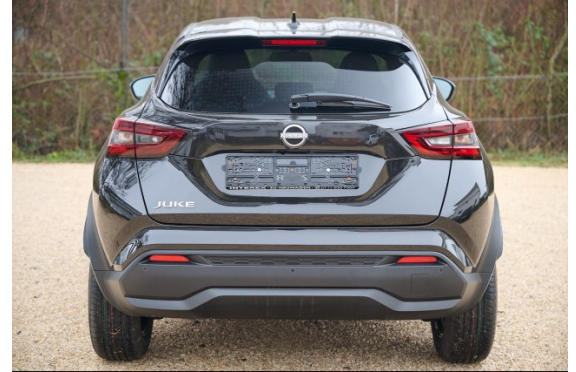
Tagesangebot Nr. AK-106554 vom 17.02.2024