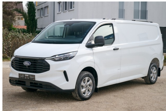
Tagesangebot Nr. K-107341 vom 08.12.2025