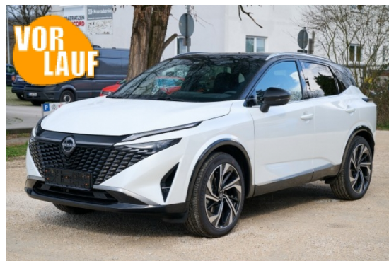
Tagesangebot Nr. K-107430 vom 09.01.2026