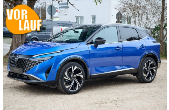
Tagesangebot Nr. K-108391 vom 17.04.2026

im Vorlauf, im Lager des ausliefernden Vertragspartners erwartet: 11.06.2026 Neuwagen