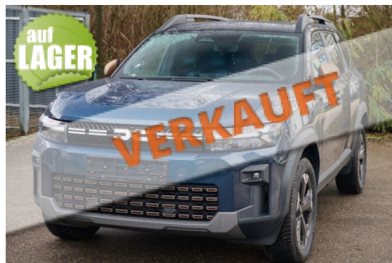
Tagesangebot Nr. S-3213 vom 03.12.2025