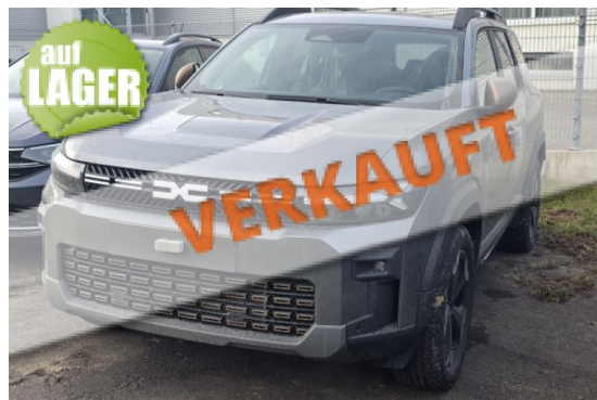
Tagesangebot Nr. S-3215 vom 28.11.2025