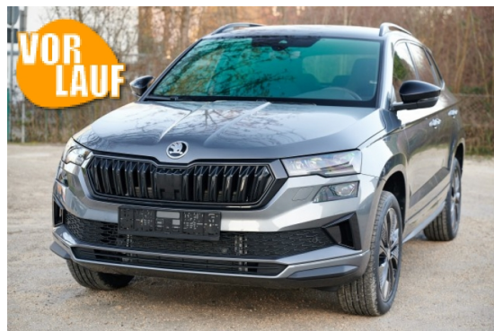
Tagesangebot Nr. K-109223 vom 14.11.2025