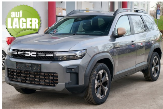
Tagesangebot Nr. S-3217 vom 21.01.2026