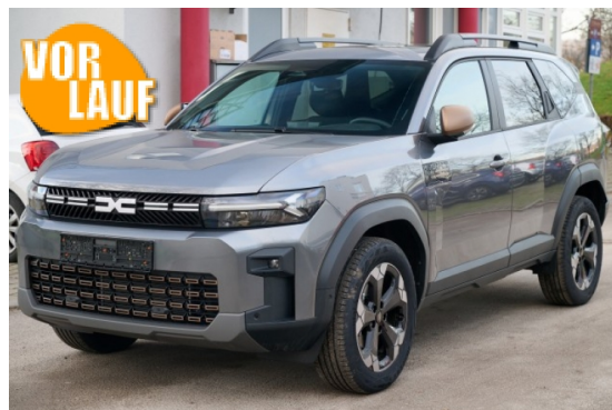
Tagesangebot Nr. S-3217 vom 03.12.2025