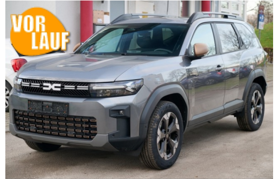
Tagesangebot Nr. S-3217 vom 17.04.2026

im Vorlauf, im Lager des ausliefernden Vertragspartners verbleibende Lieferzeit: 1 - 3 Wochen Neuwagen