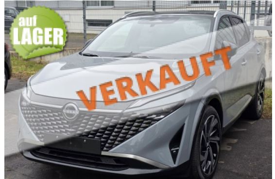
Tagesangebot Nr. K-109231 vom 09.04.2026