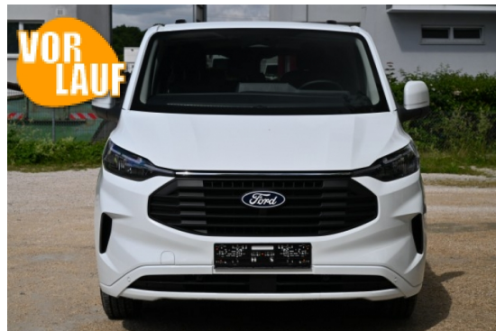
Tagesangebot Nr. K-109409 vom 08.01.2026