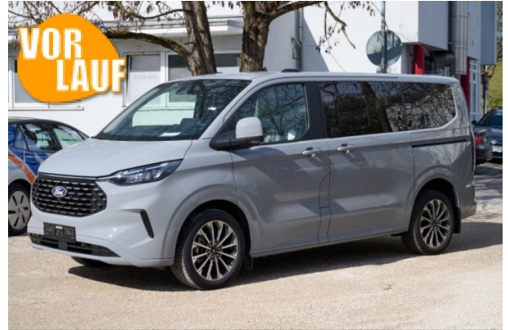
Tagesangebot Nr. K-109417 vom 17.04.2026