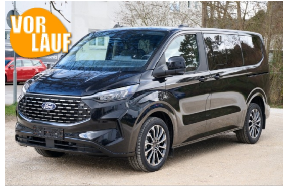
Tagesangebot Nr. K-109419 vom 17.04.2026

im Vorlauf, bereits produziert, im Werk erwartet: 20.03.2026 Neuwagen