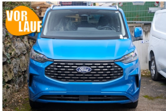
Tagesangebot Nr. K-109420 vom 15.01.2026