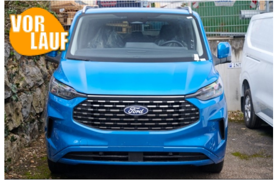
Tagesangebot Nr. K-109420 vom 17.04.2026