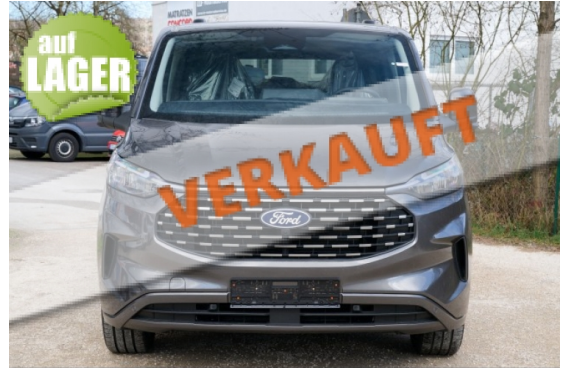
Tagesangebot Nr. K-109421 vom 18.05.2026