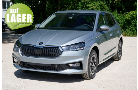
Tagesangebot Nr. K-109558 vom 03.07.2026