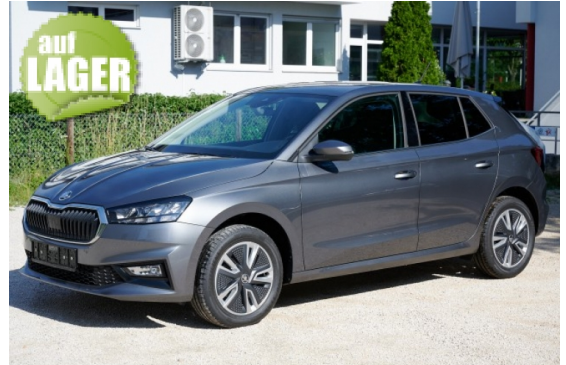
Tagesangebot Nr. K-109559 vom 14.04.2026

im Lager (bei uns vor Ort) Lieferzeit: sofort verfügbar Neuwagen