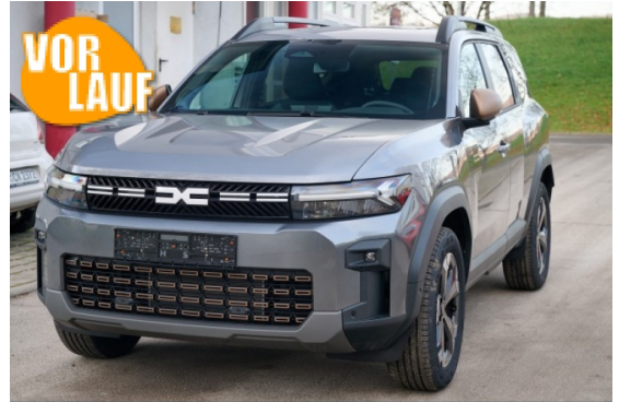
Tagesangebot Nr. S-3220 vom 15.06.2026

im Vorlauf, bereits produziert, beim Generalimporteur verbleibende Lieferzeit: 2 - 4 Wochen Neuwagen