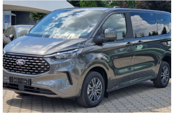
Tagesangebot Nr. K-109657 vom 17.04.2026