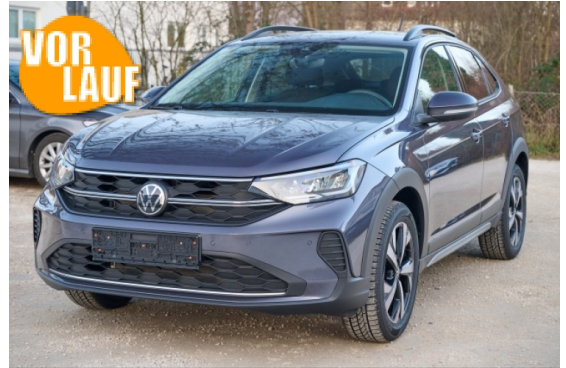
Tagesangebot Nr. K-109663 vom 11.05.2026