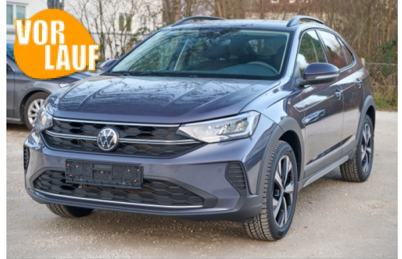
Tagesangebot Nr. K-109663 vom 24.04.2026

im Vorlauf, im Lager des ausliefernden Vertragspartners verbleibende Lieferzeit: 1 - 3 Wochen Neuwagen