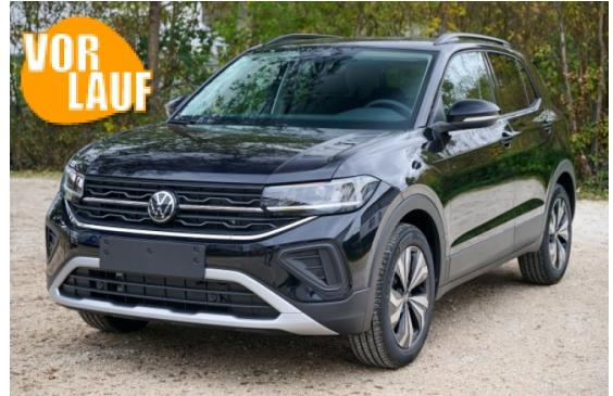
Tagesangebot Nr. K-109669 vom 28.04.2026