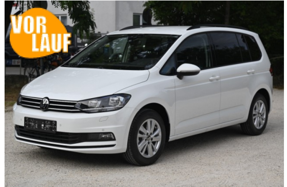
Tagesangebot Nr. K-109676 vom 08.05.2026

im Vorlauf, im Lager des ausliefernden Vertragspartners verbleibende Lieferzeit: 1 - 3 Wochen Neuwagen