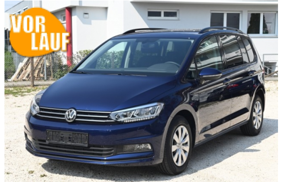
Tagesangebot Nr. K-109677 vom 11.05.2026