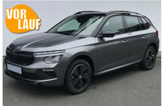
Tagesangebot Nr. K-109685 vom 16.06.2026