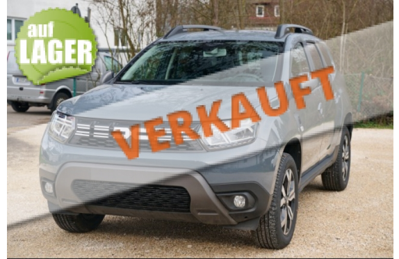
Tagesangebot Nr. K-106288 vom 16.04.2024