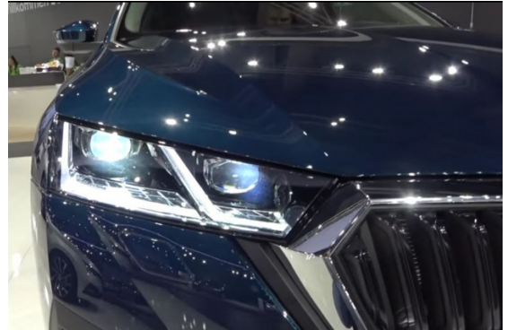
Tagesangebot Nr. AK-102815 vom 24.04.2024