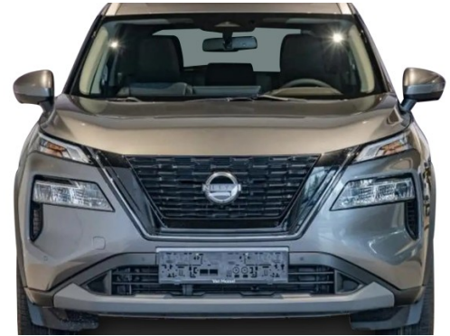
Tagesangebot Nr. AK-106048 vom 23.04.2024