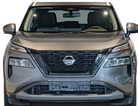
Tagesangebot Nr. AK-106045 vom 23.04.2024