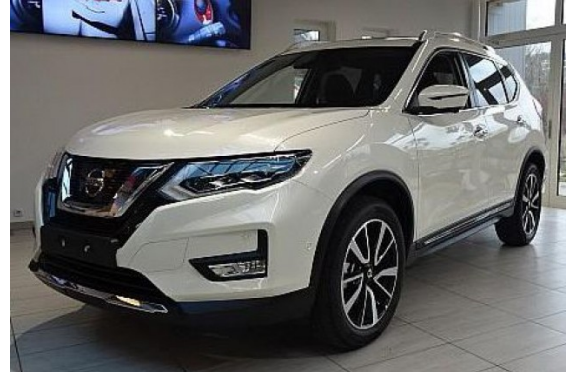
Tagesangebot Nr. AK-89822 vom 13.06.2018

Energieträgerkosten bei 20.000km, Kraftstoff Diesel mit 1,1 Euro/l: 1188 Euro.