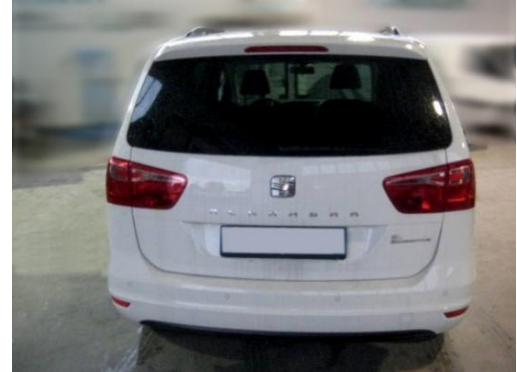
Tagesangebot Nr. AK-89045 vom 24.03.2018