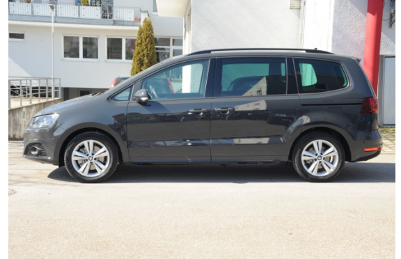
Tagesangebot Nr. AK-89088 vom 24.03.2018