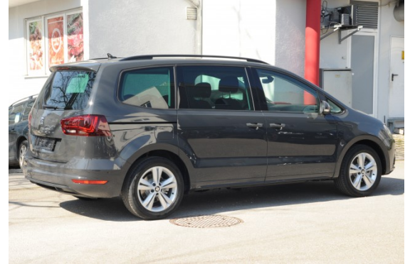
Tagesangebot Nr. AK-89085 vom 24.03.2018